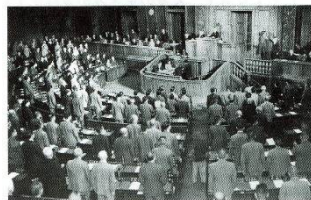
日本国憲法の可決 (1946年・衆議院)

1945年、日本が受け入れたポツダム宣言には、日本の軍国主義を取り去って、民主的な国にすることなどが要求されています。