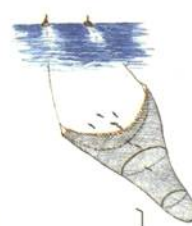
⑯ かれいなどをとる