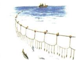
⑭ まぐろなどをとる

この(24)漁業は、1973年の(25…?ショック)による燃料の値上がりなどで漁獲量が大きく減少しました。この漁業の漁獲量を表すグラフは(26…グラフの番号で)です。