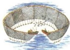
⑮ いわし・さばなどをとる