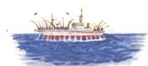
⑰ かつおなどをとる