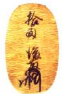
たての長さ17.8cm 豊臣氏などがつくらせ た天正大判

天下統一が目前の織田信長が、(30…人名)の謀反で自害する(31…寺名)の変がおこり、同年、豊臣秀吉が山崎の戦いで主君の敵を討ち、自分が信長の後継者になることを全国の大名に示しました。そして、豊臣秀吉は織田信長の政策を受け継いで、楽市楽座や關所の廃止、道路の整備などを行い、商工業の発展を図りました。また、金山や銀山を開発して、支配下に置き、京都・大阪・堺・博多などの重要な都市も直接支配しています。