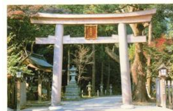
高麗神社 (埼玉県日高市)

大王や豪族たちは、彼らと積極的に結びついて、自分たちの勢力を強めていきます。こま・くだら・はた・あやなどの地名が残っているところは、これらの人たちと関係が深いようです。