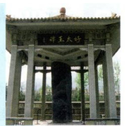
好太王の碑 (高さは6.3m)