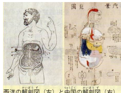
西洋の解剖図(左)と中国の解剖図(右)

さらに、(29)の弟子で、中津藩(大分県)の藩医の(30…人物名)と、小浜藩(福井県)の藩医の子の(31…人物名)ら7名の蘭学者が、オランダ語の解剖書の『(32…原書の名をカタカナで)』を翻訳し、『(33…書物名)』を出版しています。これが日本で初めての西洋医学の翻訳書です。