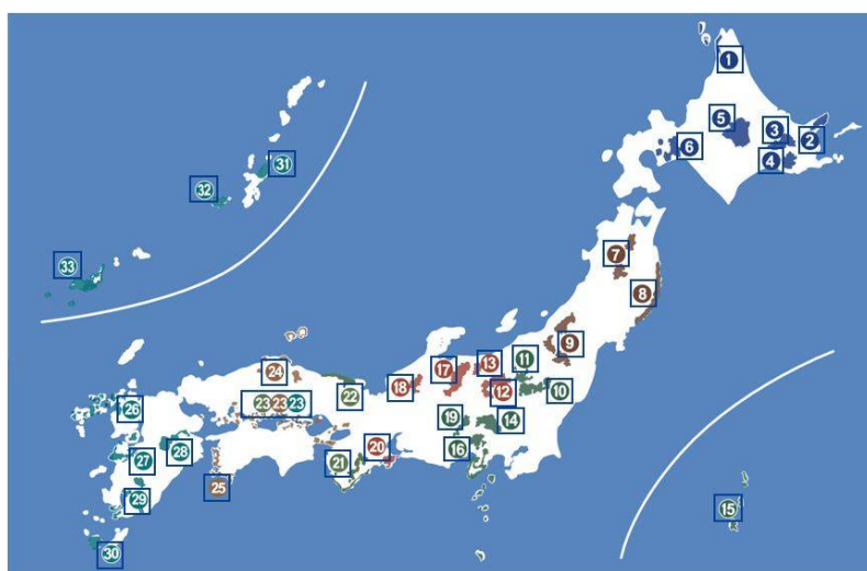
34 奄美群島国立公園

国立公園は国の役所の(22…?省)が指定して決めています。現在は全国で34か所の国立公園があります。火山と火山によってつくられた湖などの地形があり、たくさんの観光客がおとずれています。