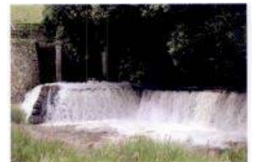
満濃池のゆる抜き